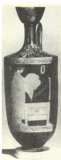
Εικ. 7. Ερυθρόμορφη λύκηθος, 470-460 π.Χ. N. Haven, Yale University Art Galery.

Από κείμενα και αναπαραστάσεις αγγείων πληροφορούμαστε για πολλά είδη ενδυμάτων όπως εσθήτα, πέπλος χιτώνας, χλαίνα, χλαμύδα, φάρος, κλπ. Τα ρούχα τα τακτοποιούσαν σε κιβώτια, (Οδύσσεια, ζ-74, θ-439, ο-439) (εικ.7.).