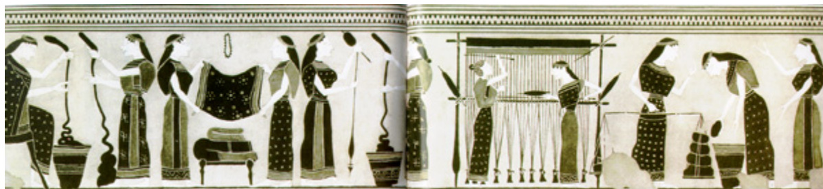
Εικ. 2. Λύκηθος 6 ος αι. (ανάπτυγμα), Metropolitan Museum, Ν. Υόρκη. Η πέμπτη γυναίκα εξ αριστερών κρατάει ρόκα και αδράχτι.

Η ηλακάτη, η ρόκα και η άτρακτος, το αδράχτι, είναι τα εργαλεία με τα οποία έστριβαν το μαλλί για να το κάνουν νήμα. (εικ. 2 και 3). Πολλές φορές η γνέστρα, χερνήτις κατά τον Όμηρο (Ιλιάδα Μ 433), δεν χρησιμοποιούσε αδράχτι αλλά έστριβε το μαλλί με το χέρι. Στον «Ορέστη» (στ. 1431) του Ευριπίδη και στους «Βατράχους» (στ. 1348-1349) του Αριστοφάνη το στρίψιμο του λινού νήματος γίνεται με το χέρι. Άλλες φορές χρησιμοποιούσε το επίνητρον (εικ. 4). Πρόκειται για πήλινη κατασκευή που κάλυπτε το γόνατο και μέρος του μηρού, ώστε το στρίψιμο του νήματος να γίνεται καλύτερα και ευκολότερα στη σταθερή και σκληρή επιφάνειά του. Το γνέσιμο του νήματος για στημόνι ανελάμβαναν οι ικανότερες γυναίκες, ελεύθερες ή δούλες, επειδή το νήμα που προορίζεται για το στημόνι πρέπει να είναι πολύ ανθεκτικό. Αυτό επιτυγχάνεται με πολύ καλό στρίψιμο της κλωστής. Το γνέσιμο του νήματος για υφάδι ανελάμβαναν οι λιγότερο ικανές ή οι αρχάριες σ' αυτή την εργασία.