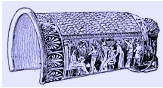
Εικ. 4. Επίνητρον

Η ηλακάτη για το γνέσιμο του λινού νήματος ονομάζεται γέρον , (Πολυδεύκης VII,73). Είναι μακρύτερη της ηλακάτης του μαλλιού διότι οι ίνες του λιναριού είναι μακρύτερες. Το γνέσιμο του νήματος θέλει δεξιοτεχνία.