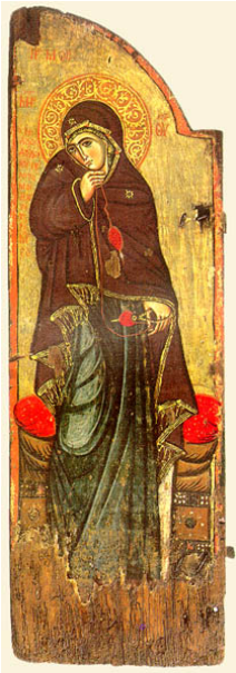
Εικ. 3. Παναγία Βημόθυρου Μονής Βατοπεδίου 1200 μ.Χ.(107x35)