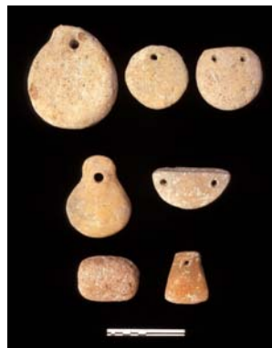
Εικ. 6. Αγνύθες πήλινες, 8 ος αι. π.Χ.

Στον αργαλειό ύφαιναν ενδύματα, σκεπάσματα, στρωσίδια, πανιά των караβιών κ.ά. Η δουλειά ήταν δύσκολη και χρονοβόρα. Ως εκ τούτου ο αριθμός των ενδυμάτων ήταν πολύ μικρός και η αξία τους πολύ μεγάλη, γι' αυτό στα αγάλματα των θεών τους προσφέρουν πέπλους. Ο πέπλος ήταν καταρχήν ένα γυναικείο ένδυμα. Αργότερα με τη λέξη πέπλος εννοείτο ένα καλό ένδυμα. Ονομαστός ήταν ο πέπλος της Αθηνάς τον οποίον περιέφεραν και έδειχναν οι Αθηναίοι κατά τη γιορτή των Παναθηναίων. Τον ύφαιναν παρθένες Αθηναίες, τις οποίες επέλεγε ο εκάστοτε άρχοντας των Αθηνών και λεγόταν εργαστίνες. Ο Ευριπίδης στην Εκάβη (στ. 456) αναφέρει ότι στον πέπλο της εικονίζοταν ο Εγκέλαδος και οι Γίγαντες καταπολεμούμενοι υπό της θεάς Αθηνάς.