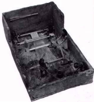
Εικ. 5. Αιγυπτιακός οριζόντιος αργαλειός.

Υπάρχουν δύο τύποι αργαλειού στην αρχαιότητα. Ο οριζόντιος (εικ. 5.) και ο κάθετος ή όρθιος (εικ. 2.). Στον όρθιο αργαλειό (Tsoskounoglou-Misopolinou A. 2003) το τέντωμα των στημονιών γίνεται με βάρη, τις αγνύθες οι οποίες ήταν λίθινες ή πήλινες και είχαν διάφορα σχήματα. (εικ. 6). Στην Αίγυπτο ο όρθιος αργαλειός ήταν προηγμένης τεχνολογίας από τον αργαλειό με βάρη. Σ' αυτόν, το τέντωμα του στημονιού γινόταν με τη χρήση και δεύτερου αντί (εικ. 1).