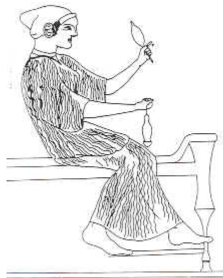
Παράσταση της Αθηνάς Εργάνης (Μουσείο Ακροπόλεως Αθηνών)