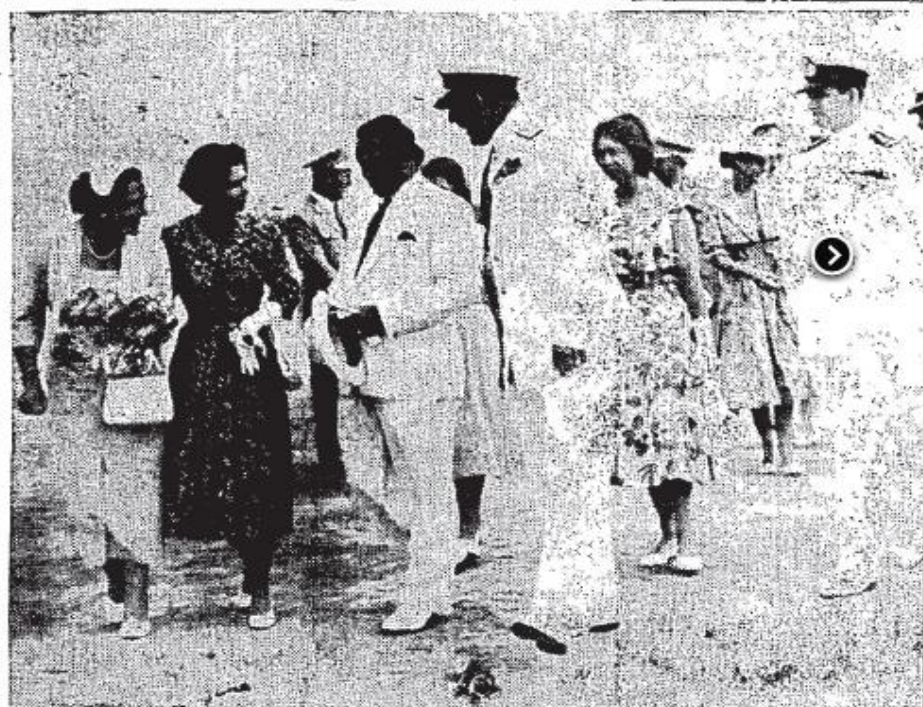
Ἀπὸ τὴν ἀφίξιν εἰς Κέρκυραν τοῦ Προέδρου Τίτο καὶ τῆς συζύγου του, τοὺς ὁποίους ἀνέμενον καὶ ἀπεδέχθησαν εἰς τὴν ἀποβάθρην οἱ Βασιλεῖς. Ἀνωτέρω ἐξ ἀριστερῶν πρὸς τὰ δεξιὰ: Ἡ σύζυγος τοῦ Γιουγκοσλαβικοῦ Προέδρου, ἡ Βασίλισσα Φρειδερίκη, ὁ στρατάρχης Τίτο, ὁ Βασιλεὺς, ἡ Πριγκίπισσα Σοφία καὶ ὁ Διάδοχος Κωνσταντῖνος μετὰ τὸν δεξιῶν τοῦ Β. Ναυτικοῦ.

Εἰδικότερον ἐκ τῶν ἐπισημῶν ἐλληνοκινῶν κώλων ἐβλήθητο πλήρως ἔγχοια περὶ προστάσεως τυχόν τοῦ στρατάρχου Τίτο ὅπως προσερίθῃ τὴν μεσοδόξιν του διὰ τὴν μείωσιν τῆς