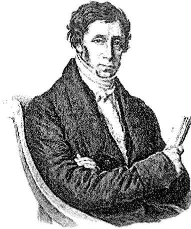
Ο Charles Pictet de Rochemont (1755-1824)

Καθ' όλη τη διάρκεια του Συνεδρίου της Βιέννης, ο Καποδίστριας αποδεικνύεται πιστός σύμμαχος των Ελβετών και συγκεκριμένα του Pictet de Rochemont, όπως επιβεβαιώνεται από την ογκώδη διπλωματική τους αλληλογραφία. Βρισκόμαστε ενώπιον μιας μοναδικής συνεργασίας μεταξύ των δύο αντρών, οι οποίοι συναντώνται πολύ συχνά, χωρίς το πρωί. Ο Pictet ενημερώνεται για τις τελευταίες εξελίξεις των διαπραγματεύσεων. Ορισμένες φορές, ο Καποδίστριας του ζητά να του υποβάλει σχέδια και αιτήματα που αφορούν την Ελβετία, προκειμένου να τα διαβιβάσει, εξ' ονόματός του, στους τότε αξιωματούχους υπουργούς στη Βιέννη. Οι δύο άντρες μοιράζονται στιγμές ικανοποίησης, αλλά και απογοήτευσης: ο τροχός της διπλωματικής τύχης γυρίζει αδιάκοπα. Μπορούμε να βεβαιώσουμε, χωρίς να ανατρέξουμε σε λεπτομέρειες, συμφωνώντας με τον Pictet και τον συνάδελφό του d'Ivernois, ότι ο Καποδίστριας υπήρξε ο πιο πιστός δικηγόρος, ακούραστος και πλέον αποτελεσματικός μεσολαβητής των συμφερόντων της Γενεύης και της Ελβετίας στη Βιέννη.