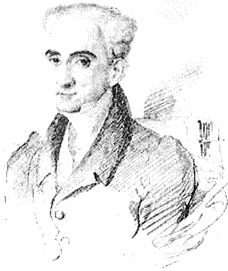
Ο Καποδίστριας, σχέδιο του Brioullon, γύρω στα 1820

Ο Καποδίστριας λοιπόν φτάνει στην Ελβετία τον Νοέμβριο του 1813 και θα παραμείνει εκεί ως τον Σεπτέμβριο του 1814. Φέρει τον τίτλο του έκτακτου απεσταλμένου και εξουσιοδοτημένου αντιπροσώπου του Ρώσου Τσάρου. Συνεργάτες του είναι ο Αυστριακός διπλωμάτης, Lebzelter, αργότερα ο Schraut, επίσης ένας Άγγλος, ο Cunning και άλλοι. Κανείς τους όμως δεν θα παραμείνει στην Ελβετία καθ' όλη αυτή την περίοδο, και όπως επισημαίνει και η κ. Michèle Bouvier-Bron, ο Καποδίστριας «αδιαμφισβήτητα άσκησε την πλέον καθοριστική επιρροή» μεταξύ των απεσταλμένων των Μεγάλων Δυνάμεων.