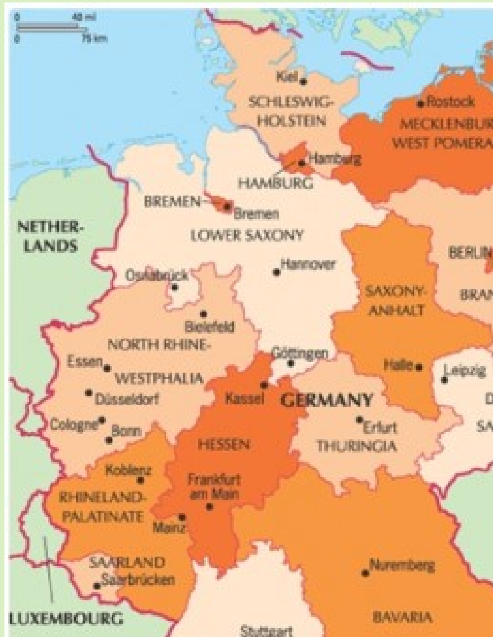
Μιχάλης Πολίτης ΤΕΓΜΔ Ιονίου Πανεπιστημίου