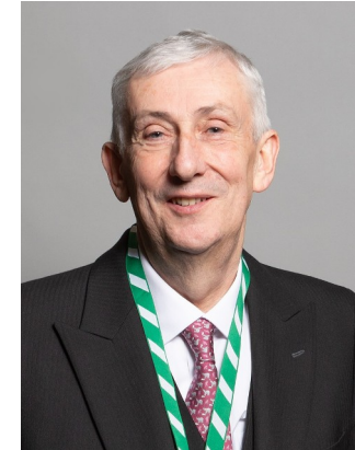
Ο νυν Πρόεδρος της Βουλής των Κοινοτήτων Sir Lindsay Hoyle