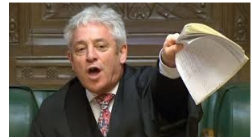
John Bercow Πρόεδρος της Βουλής των Κοινοτήτων μέχρι το 2019