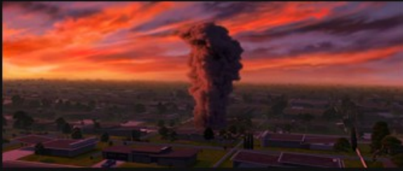
Extreme Wide Shot