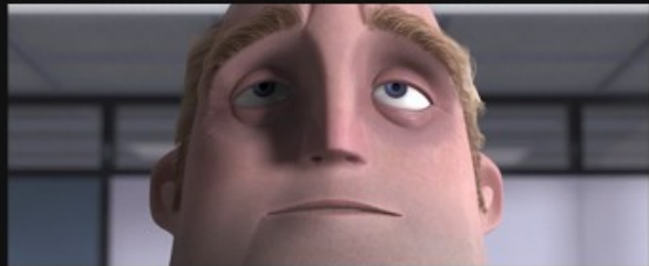
Extreme Close-up Shot