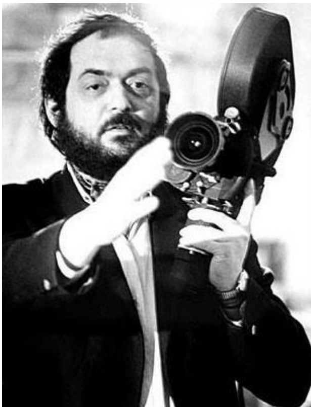
Εικόνα 4: Ο δημιουργός Σ. Κιούμπρικ