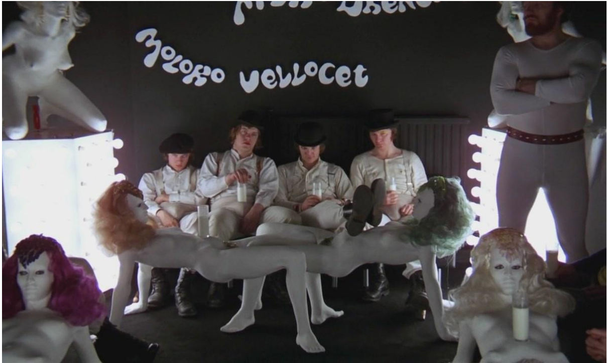
Εικόνα 3: Στιγμιότυπο από την ταινία