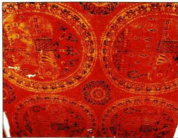
8α. Εξόμφο πορφυρώ μεταξινό (περίπου 1000 μ.Χ.) των αυτοκρατορικών εργαστηρίων, κοσμημένο με ελέφαντες. β. Λεπτομέρεια του μεταξινό με την ενυφασμένη επιγραφή.

Το νέο και δυναμικό στοιχείο του βυζαντινού βεστιαρίου, που μοιράζονται όλες οι κοινωνικές ομάδες, αποτελούν από την αρχή της βυζαντι-