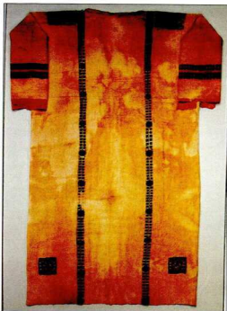
2. Κοπτική χιτώνας (5ος αι.), διακοσμημένος με την τεχνική της ταπισερί: είναι το τυπικό ένδυμα όλων των κοινωνικών τάξεων κατά την πρώιμη βυζαντινή περίοδο.