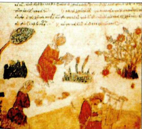
6. Οριζόντιος αργαλειός με μπάρι και πατηματο τύπος αργαλειού που εκπάρτησε μέχρι τους νεότερους χρόνους.

Το μέγεθος του αργαλειού αυτού του είδους, ο οποίος καταλαμβάνει μεγάλο χώρο, και η πολύπλοκότητα της λειτουργίας του, που προϋποθέτει μεγάλο χρόνο κατά την αρχική διευθέτηση των νημάτων που καθορίζει κάθε φορά τη μορφή των παραγόμενων υφασμάτων και τη διαρκή συνεργασία περισσότερων προσώπων κατά την ύφανση, καταδεικνύουν ότι δεν ήταν δυνατό να ενταχθεί στα πλαίσια της οικογενείας. Η προμήθεια και η χρήση τέτοιων αργαλειών και, συνακόλουθα, η κατασκευή των περιτεχνών, από πολύτιμα συνήθως υλικά εξημελιστών υφασμάτων που παράγον, επιβάρυναν την οργάνωση μεγαλύτερων μονάδων παραγωγής. Από στοιχείο συνιστά ομάδα πορφυρών, εξάμιτων, μεταξωτών υφασμάτων που φέρουν, υφασμένα, τα ονόματα των αυτοκρατόρων του 10ου και 11ου αιώνα ή –σε μία περίπτωση (εικ. 8 α, β)– το όνομα του άρχοντος του βασιλικού εργοδοσίου στο οποίο είχε υφανθεί: «+ Επί Μιχ(αήλ) πριμ(κηνίου) επί του) κοπ(ιωνος) (και) ειδικού / + Πέτρον αρχον(ι)ος του Ζευδ(η)του ινδ(ικτιώνος) [...]». Πρόκειται για υφάσματα που είχαν υφανθεί στα κρατικά αυτοκρατορικά εργαστήρια, ενώ την ίδια περίοδο, σύμφωνα με το Επαρχικό Βιβλίο, υπήρχαν στην Κωνσταντινούπολη συνεχιείς ιδιωτών, που