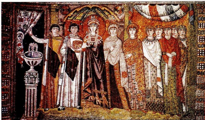
3. Η αυτοκράτειρα Θεοδώρα και η ακολουθία της φορούν ενδύματα, των οποίων τα υφάσματα είτε φέρουν διακόσμο σε περιορισμένες ζώνες (πράσινο, εκτεταμένο με την τεχνική της ταπισερί) είτε κοσμούνται σε όλη τους την έκταση (ζομπλιαστά υφάσματα).