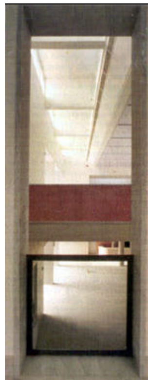
Μουσείο Βυζαντινού Πολιτισμού (Αρχιτέκτων Κυριάκος Κρόκος)

Το Φως σαν φυσικό φαινόμενο (Φυσικό Φως) με τις συγκεκριμένες ιδιότητες του γεωγραφικού πλάτους και του μικροκλίματος (Τεχνητό Φως) με τον συνδυασμό φωτιστικής πηγής ανακλαστήρα, εκπέμπεται από τον ουράνιο θόλο/φωτιστικό προς (και περιβάλλει είτε εμπειριέχεται) την τοποθεσία το κτίσμα και τα εκθέματα. Παράλληλα το Φως σαν νοηματική