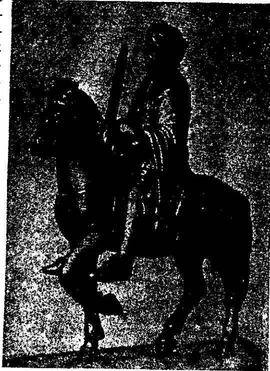
Ο Κάρολος ο Μέγας. Όρειχάλκινο ειδώλιο του 9. αιώνα. ( *Λογο του 16. αιώνα ).

Το κομμάτιασμα της φεουδαρχικής κοινωνίας σε διάφορες κλειστές από οικονομική και πολιτική άποψη μικρές κοινωνίες, και το γενικό σπάσιμο των εμπορικών, των πολιτικών και των πολιτιστικών σχέσεων που υπήρχαν στη