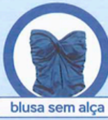
blusa sem alça