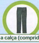
a calça (comprida)