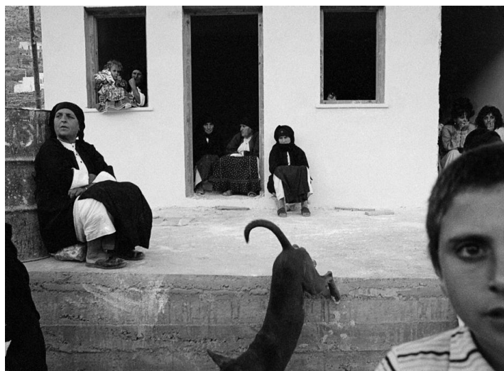
Εικόνα 4. Γυναίκες παρακολουθούν το χορό σε τοπικό πανηγύρι (Αυλώνας, 1989)

μικρολεπτομέρειες του, αποκτούν μεγάλη βαρύτητα και σημασία με αποτέλεσμα να υπάρχουν πολλά οπτικά επίπεδα και μεγάλο «θεματικό βάθος», όπως φαίνεται και στην εικόνα 4.