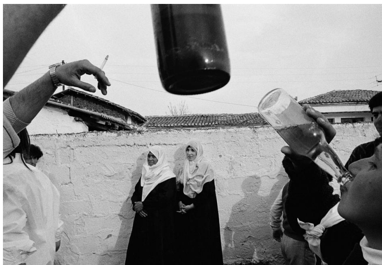
Εικόνα 1. Περιοχή Θράκης κοντά στην Ξάνθη. Μουσουλμανικός γάμος, 1991.

Ένα μεγάλο μέρος του έργου του Οικονομόπουλου αποτελείται από τη φωτογράφιση περιοχών της Ελλάδας, της Τουρκίας και των Βαλκανίων. Παρόλο που πολλές από τις εικόνες του συχνά μπορεί να δίνουν στο θεατή ορισμένες λαογραφικές πληροφορίες ή στοιχεία πολιτισμικής ταυτότητας, ο Οικονομόπουλος δεν προσπαθεί να καταγράψει αυτά τα στοιχεία με ντοκιμαντερίστικο τρόπο, αλλά να τα αποθανατίσει με μία δική του δημιουργική ματιά έτσι ώστε να προκύψουν οπτικά ενδιαφέρουσες και δυνατές εικόνες, όπως η παρακάτω (εικόνα 1). Παρόλο που είναι ιδιαίτερα σημαντικό (και ενδιαφέρον) να παρατηρήσει κανείς στην εικόνα 1 τις ανθρώπινες σχέσεις και τη θέση της γυναίκας στη μουσουλμανική μειονότητα της Θράκης, η συγκεκριμένη φωτογραφία είναι και κάτι παραπάνω, καθώς έχει μία οπτική αυτονομία πέρα από το θέμα που περιγράφει.