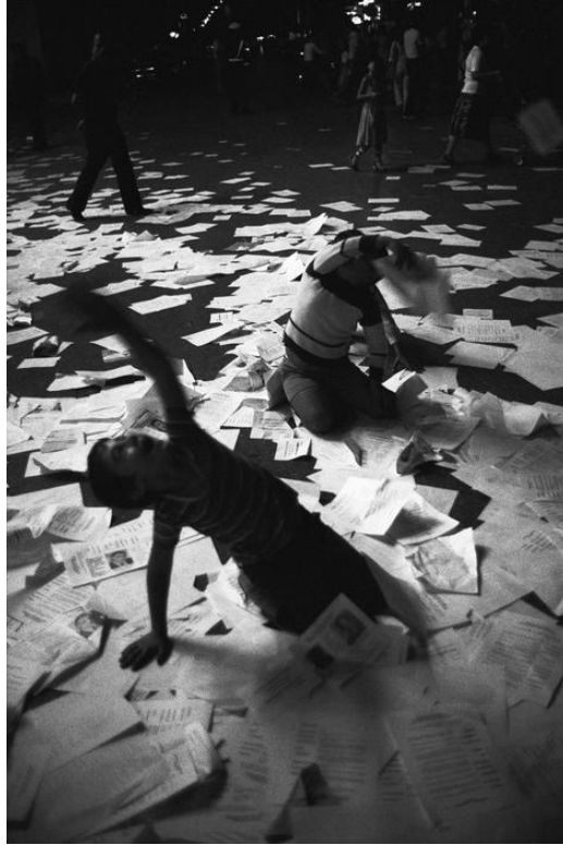
Εικ. 6. Καλαμάτα, περίοδος εκλογών. 1981