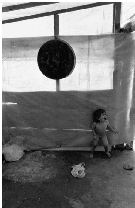
Εικ. 3. Καταυλισμός τσιγγάνων. Θεσσαλία-Τύρναβος, 1994.

Σε πολλές φωτογραφίες παρατηρείται πως το βασικότερο ή το πιο ενδιαφέρον στοιχείο μιας εικόνας, αντί να απομονωθεί, παρουσιάζεται αντιστικτικά με πολλά άλλα στοιχεία που φαινομενικά δεν είναι τόσο σημαντικά, όπως π.χ. στην εικόνα 3. Το πιο προφανές θα ήταν να εστιάσει κάποιος περισσότερο στο παιδί που κλαίει, αλλά εισάγοντας και άλλα στοιχεία όπως το μεταλλικό στρογγυλό σκεύος, η εικόνα αποκτά μεγαλύτερο οπτικό ενδιαφέρον. Χαρακτηριστικά, ο Οικονόπουλος έχει πει: «Ένα μεγάλο λάθος που κάνουν οι ερασιτέχνες (φωτογράφοι), είναι πως όταν δουν κάτι το τόσο ενδιαφέρον, προσανατολίζουν την μηχανή τους στο peak αυτού του ενδιαφέροντος, ενώ το ενδιαφέρον σ' αυτό είναι όταν αυτό αποτελεί ένα από τα στοιχεία του κάδρου. Ένα στοιχείο αποκτά ενδιαφέρον όταν ο περιβάλλον χώρος προσδίδει και άλλα χαρακτηριστικά, τα οποία ενισχύουν το ενδιαφέρον του κυρίως θέματος και της εικόνας γενικότερα» . Έτσι ο συνολικός χώρος με όλες τις