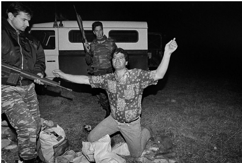
Εικ. 8. Ελληνική στρατιωτική περίπολος που μόλις συνέλαβε μια ομάδα Αλβανών που προσπάθησαν να περάσουν παράνομα τα σύνορα το βράδυ.

Ενώ όπως ειπώθηκε και πιο πριν η προσέγγιση του Οικονομόπουλου απομακρύνεται σε γενικές γραμμές από τη δημοσιογραφική καταγραφή, υπάρχουν παρόλα αυτά και κάποιες φωτογραφίες του που τείνουν προς την απλή καταγραφή καταστάσεων-ντοκουμέντων όπως η παρακάτω (εικ. 8)