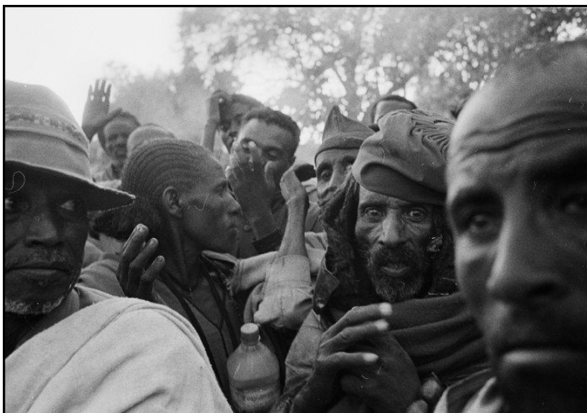
Εικ. 9. Προσκυνητές τα Χριστούγεννα, (Αιθιοπία, Λαλιμπέλα, 2005).

Πέρα από τα Βαλκάνια και τις κοντινές σε αυτά χώρες, ο Οικονομόπουλος έχει φωτογραφίσει και σε πολλά άλλα μέρη του κόσμου όπως η Αφρική (εικ. 9), η Ασία και η Κούβα, διατηρώντας συνήθως μια προτίμηση για υποανεπτυγμένες χώρες ή περιοχές, πληθυσμιακές μειονότητες και ανθρώπους με απλές συνθήκες ζωής, αποφεύγοντας συνήθως τις μεγαλουπόλεις και την φωτογράφιση του πλέον καθιερωμένου δυτικού τρόπου ζωής της καταναλωτικής κοινωνίας.