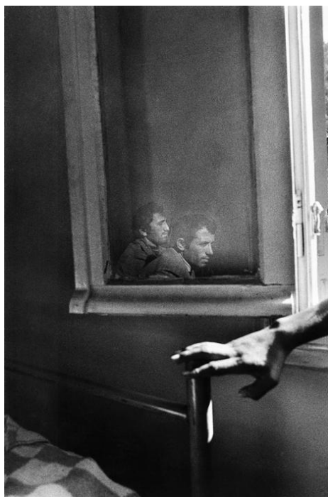
Εικ. 2. Αλβανοί λαθρομετανάστες στο τοπικό αστυνομικό τμήμα. Ελλάδα-Δελβινάκι, 1990

Οι δύο γυναίκες αποτελούν το επίκεντρο, αλλά και όλα τα υπόλοιπα στοιχεία της εικόνας —τα κομμένα αντρικά πρόσωπα, τα χέρια και τα μπουκάλια—, έχουν επίσης σημαντικό θεματικό, οπτικό και δομικό ρόλο. Η φόρμα και ο τρόπος στησίματος του κάδρου παίζουν μεγάλο ρόλο στις φωτογραφίες του Οικονομόπουλου, ο οποίος μέχρι και το 2010 περίπου τράβαγε αποκλειστικά ασπρόμαυρες εικόνες χρησιμοποιώντας συχνά έντονη τονική αντίθεση (εικόνες 2 και 3).