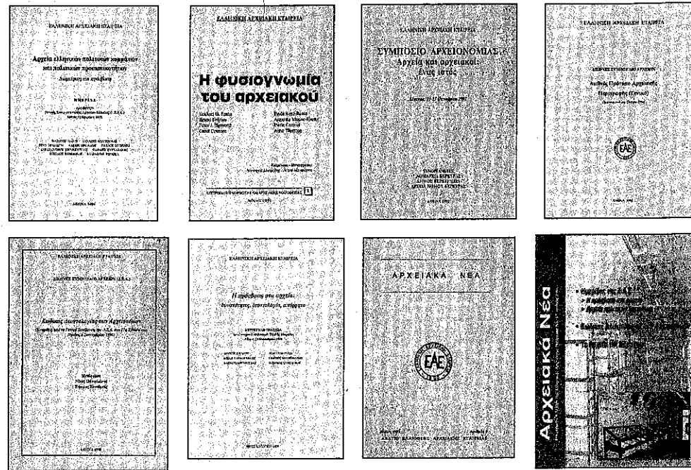
Εκδόσεις της Ελληνικής Αρχειακής Εταιρείας.

Αν και αυτές οι δραστηριότητες δεν συνιστούν το κύριο αντικείμενο του βιβλίου, αποτελούν εν τούτοις ένα σημαντικό μέρος του πλαισίου μερικών αρχειακών προγραμμάτων.